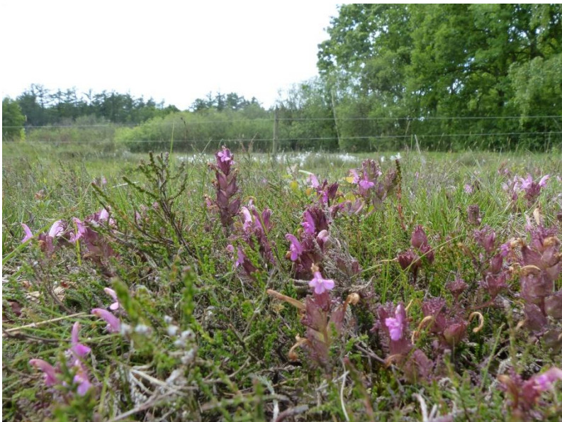
Heidekartelblad. In april/mei bloeiende halfparasiet.

Het is een halfparasiet. Door via de wortels voedsel bij grassen af te tappen weet hij zich prima staande te houden in een voedselarme omgeving. Bovendien put hij op de manier zijn gastheer uit die daardoor wegwijnt zodat de vegetatie openblijft waardoor bijvoorbeeld een teer plantje als liggende vleugeltjesbloem ook een kans krijgt. Dat geeft in het voorjaar een prachtig kleurrijke vegetatie.