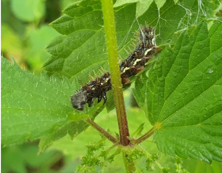
Rups van Atalanta op brandnetel

Ja, brandnetel is een belangrijke voedselplant voor rupsen van diverse vlindersoorten.