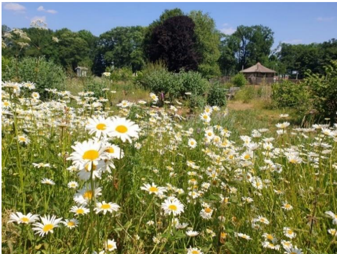
Vlindertuin het Laar

In de Ommermars kwam o.a. het grasklokje prachtig tot bloei. Mooi om te zien dat de stroomdalflora zich herstellen kan. In een dichte grasmat maken deze soorten geen schijn van kans. Maar in een open zandige omgeving, zoals bijvoorbeeld na een flinke overstroming van de Vecht waarbij vers zand wordt afgezet, kunnen ze zich opnieuw vestigen.