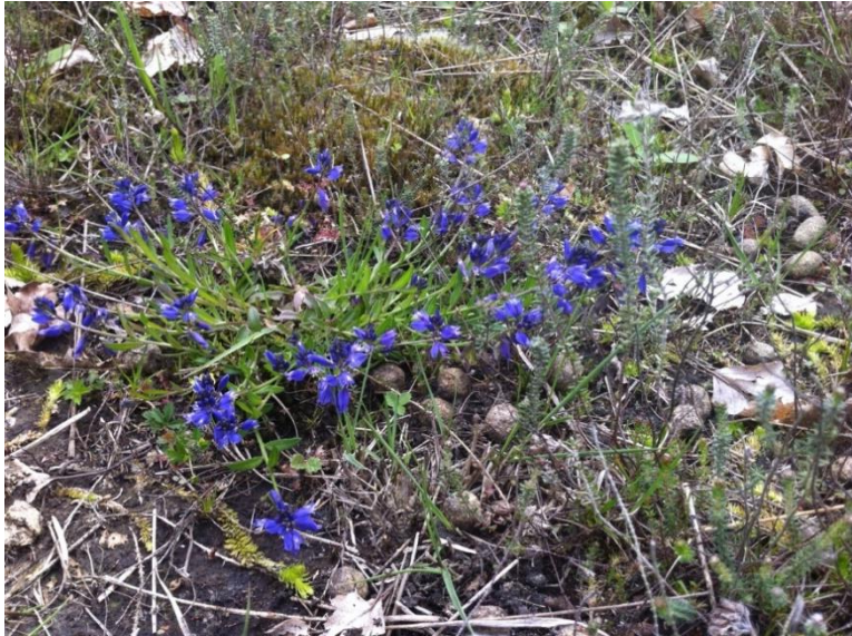
Liggende vleugeltjesbloem en Moeraswolfsklauw. (lichtgroene kruipend stengeltje op de voorgrond) Beiden gebaat bij een open , voedselarme vegetatiestructuur.