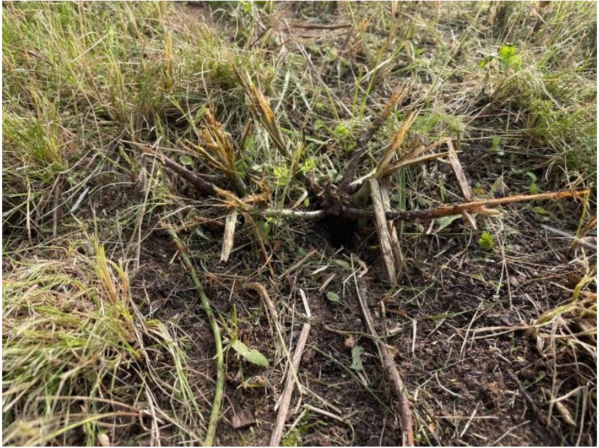
Klepelmajaier van de gemeente maait 'per ongeluk' ook de struikjes af. © Hopelijk lopen die dit jaar weer uit.