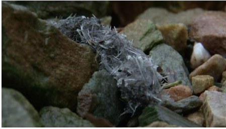
Otterspraint (met veel visgraten)