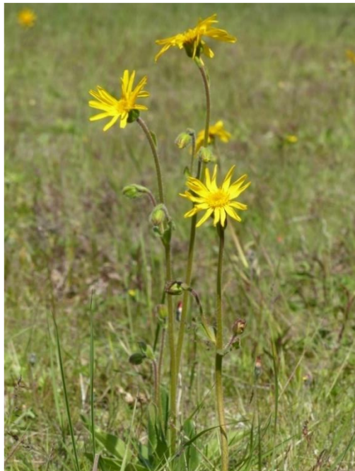
Ook het Valkruid ( Arnica montana ) bloeide dit jaar weer prachtig.