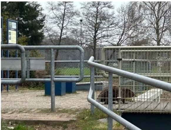
Bever stuw Vilsteren

Bij de stuw in Vilsteren is begin april ook een bever gezien, die liep zelfs 'gewoon' over de stuw. Ook dit was waarschijnlijk een zwervend dier op zoek naar een geschikte plek en/of partner.