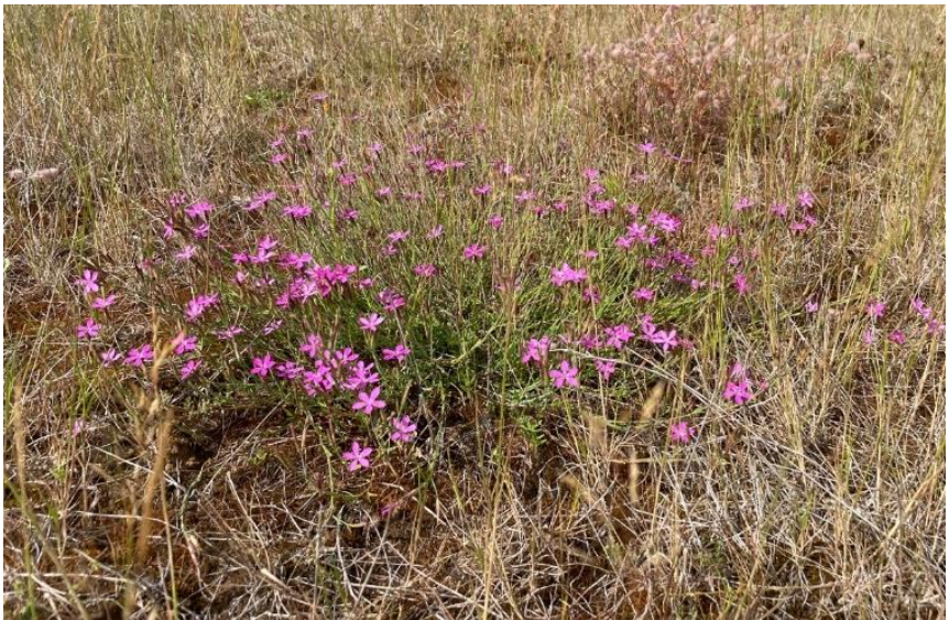
Ondanks de droogte bloeit de steenanjer in het verdorde gras uitbundig.