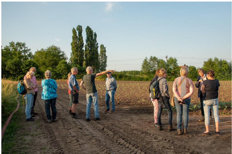
Excursie Biologisch-dynamisch boerenbedrijf te Raalte

Helaas ging de lezing over de Engbertsdijksvenen op 3 april wegens omstandigheden niet door. De excursie door het gebied, een kleine drie weken, later gelukkig wel. De lezing is verplaatst naar 8 april 2024.