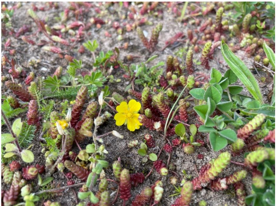
Een voorjaarsganzerik tussen de muurpeper. Wie het kleine niet eert.....

Door de extreme droogte van het voorjaar was het ogenschijnlijk een dorre vlakte maar bij nader inzien was er nog genoeg te beleven. Veel planten zijn gespecialiseerd in het omgaan met droogte. Daar waar het gras afsterft door de droogte nemen kleine plantjes de kans waar om tot bloei te komen. Daarvoor moet je soms wel even door je knieën maar dat is de moeite waard.