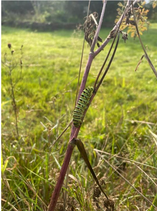
Koninginnepagerups op wilde peen.