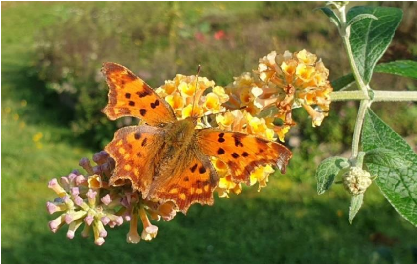
Gehakelde aurelia op geel bloeiende vlinderstruik.