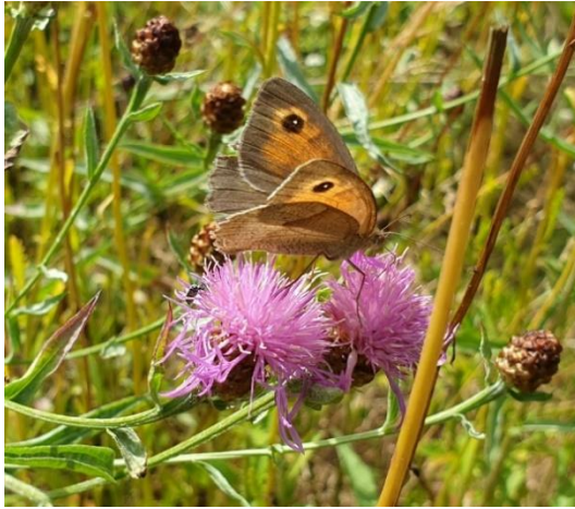
Bruin zandoogje op knoopkruid